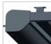
Markisenkasten mit Führungsschienenhalter