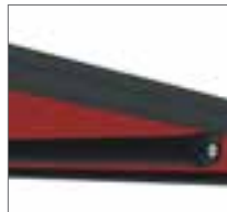
optimale Stabilisierung durch Windlastträger